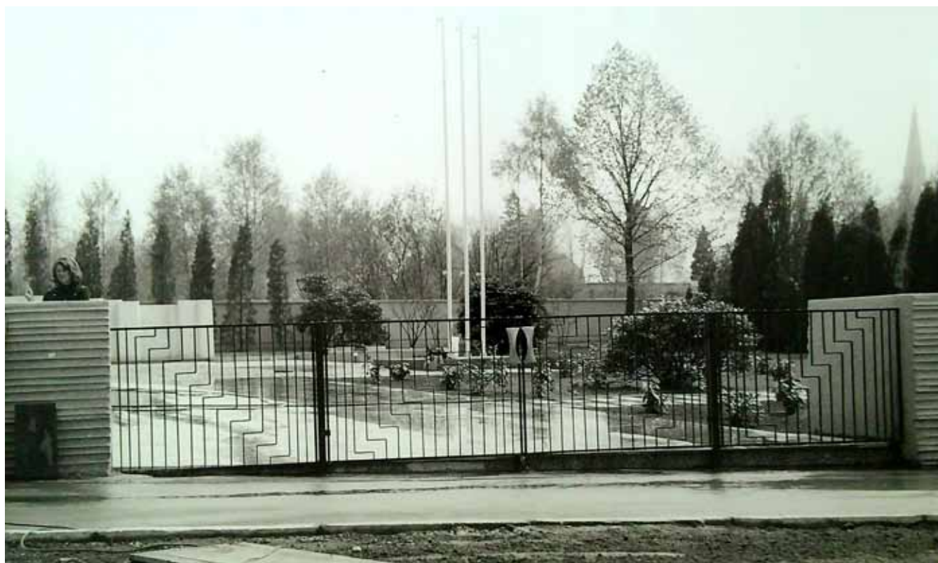
Kovová vrata pro hřbitov obětí 1. a 2. světové války v Liberci – Ruprechticích, 1974, ocel, bronz

Dominantním tématem, které proplouvá celou tvorbou autorky, je geometrie. Střídání čtverců, obdélníků nebo kruhů, jejich násobení nebo dělení na menší