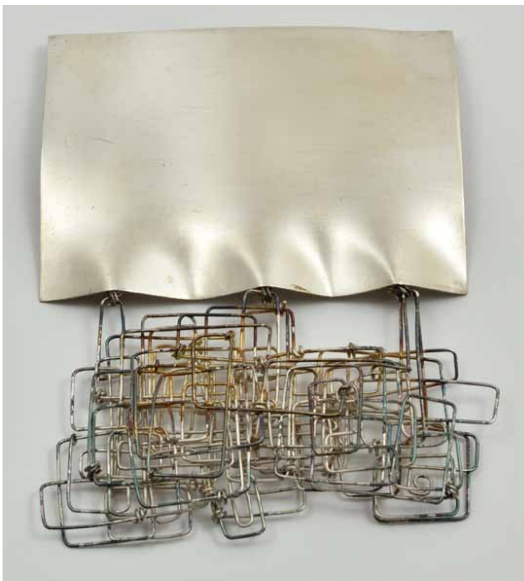
Brož, 1968, symposium Stříbrný šperk Jablonce '68, stříbro, 75 × 100 × 8 mm, sbírka Muzea skla a bižuterie v Jablonci n. N.

sympoziu autorského šperku: Stříbrný šperk Jablonce '68. Symposium bylo uspořádáno v dílnách jabloncké uměleckoprůmyslové školy. V sérii stříbrných šperků zde Reytharová navázala na svou diplomní práci. Využila v nich kinetické prvky, kde kombinovala plochy stříbrného plechu se strukturami z drátu smotávaného do geometrických obrazců. V tvarosloví svých prací refletovala současné dění ve volném výtvarném umění, které reagovalo na projevy strukturální a geometrické abstrakce. Její kolekce broží a náhrdelníků si pohrává s různými variantami tváření stříbrného plechu a drátu. Jednou vytváří stříbrný plech jakýsi obrazový rámeček pro proplétanou drátěnou kompozici a jindy je plech na okraji mírně zprohýbaný a drát tvoří jen jemný doplň-