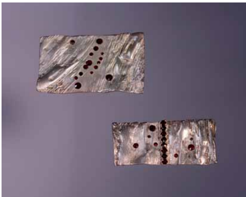
Brože, 1998, Sympozium Šperk s českými granáty, 36 × 62 a 25 × 62 mm, stříbro, české granáty, 36 × 62 a 25 × 62 mm, sbírka Muzea Českého ráje v Turnově

11_1990-1994 Střední výtvarné učiliště textilní, Liberec; 1994-1995 Právní akademie, Liberec; 1995-1999 Střední umělecká škola Frýdlant.