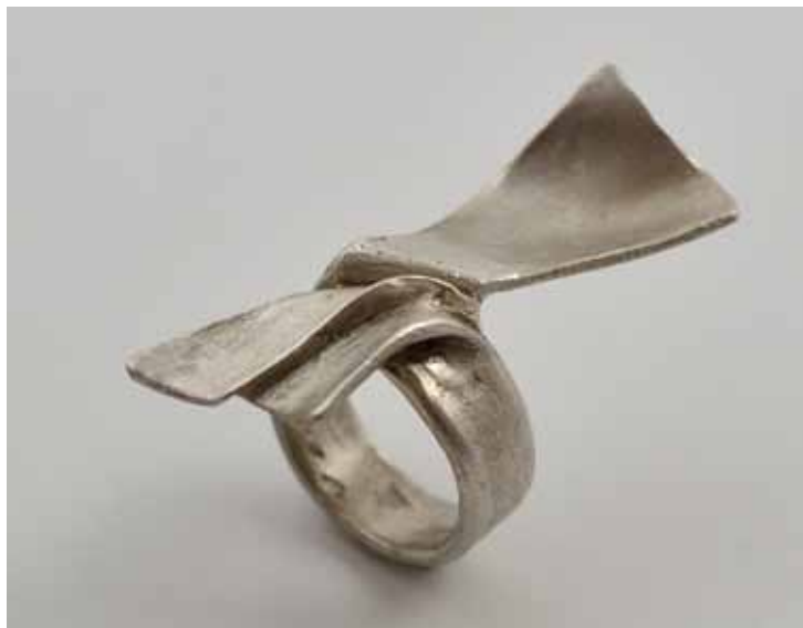
Prsten, 1978, stříbro, 24 × 40 mm, sbírka Muzea skla a bižuterie v Jablonci n. N.

výtvarného výrazu, který politicky ani společensky neprovokoval a udržel si důstojnou nadčasovost.