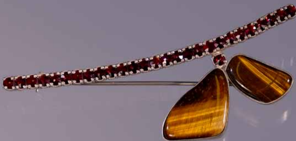
Brož, 1998, Symposium Šperk s českými granáty, 82 × 20 × 5 mm, stříbro, české granáty, tygří oko, sbírka Muzea Českého ráje v Turnově

doba sice přinesla jí i mnohým kolegům a kolegyním v oboru radost z uvolnění politických poměrů a možnost samostatných necenzurovaných výstav 12 , ale zároveň přispěla i k mnoha rozčarováním. Zejména v souvislosti s překotným vývojem rozpadajících se zaběhnutých systémů prodeje výtvarných děl anebo získávání zakázek pro autory registrované v ČFVU. Tehdy také začala nastupovat nová generace mladších šperkařů, kteří přistupovali k tvorbě šperků již nejen jako k nositelnému artefaktu s osobitým výtvarným výrazem, ale zejména jako k volnému umění, prezentovanému v souvislosti s lidským tělem. Tato změna názoru, tvůrčího přístupu, využívání nových materiálů 13 a generační výměna posunula E. Reytharovou spolu s mnoha dalšími vrstevníky a vrstevnicemi na jinou kolej. Přesto jí ale zůstalo ještě mnoho sil k další výrazné vlastní tvorbě, kterou zúročila nejen na sympoziích ale i na vlastních