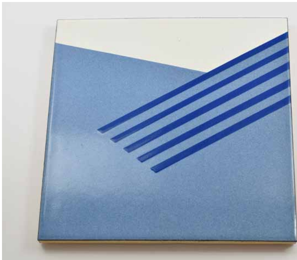
Nástěnný obraz, 1993, měď, email, dřevo, 212 × 215 × 10 mm, sbírka Muzea skla a bižuterie v Jablonci n. N.

14_Kanada, SRN, SSSR, Ma- ďarsko, Rumunsko, Švýcarsko, Slovensko