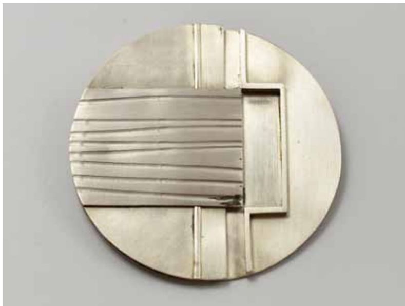
Brož, 1971, symposium Stříbrný šperk Jablonec '71, stříbro, Ø 75 × 10 mm, sbírka Muzea skla a bižuterie v Jablonci n. N., foto David Lejsek