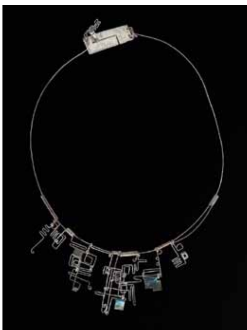
Náhrdelník, kolem 1965, stříbro, průměr 140 × 39 mm, sbírka Muzea skla a bižuterie v Jablonci n. N.

1_Viz seznam literatury. 2_Jeden z komplexnějších medailonů autorky byl publikován v odborné knize: NOVÁKOVÁ Kateřina, Nora (ed.), HRUŠKOVÁ Kateřina, NOVÝ Petr. Kaleidoskop vkusu. Československá bižuterie na výstavách 1948 - 1989 . Muzeum skla a bižuterie v Jablonci nad Nisou. 2020. ISBN 978-80-86397-36-8, s. 188. 3_Autorem většiny z nich je historik umění PhDr. Antonín Langhamer a jednoho textu PhDr. Alena Křížová.