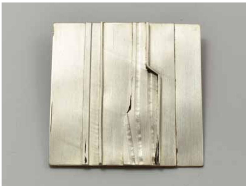
Brož, 1971, symposium Stříbrný šperk Jablonec '71, stříbro, 80 × 65 × 10 mm, sbírka Muzea skla a bižuterie v Jablonci n. N.