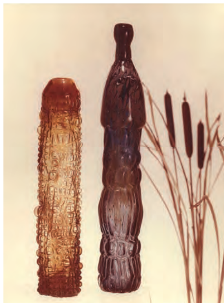
Obr. 7. Vázy tvarované v drátěných formách, návrh: Pavel Hlava, realizace: Český křišťál, Chlum u Třeboně, konec 60. let 20. století.

dotvářel předměty vpichy za použití kovových nástrojů. Tím narušoval a měnil vnitřní prostor nádob, zároveň vytvářel nový dekorativní prvek (obr. 6). Toto přebudovávání Hlavu doslova fascinovalo a v nejrůznějších podobách se k němu vracel po zbytek života, často na autorských originálech. Mezi jeho další hutní experimenty patřilo v 60. letech 20. století tvarování za pomoci drátěných či speciálně upravených dřevěných forem a nožů. Takto vznikaly masivní pestrobarevné předměty organického vzhledu (obr. 7), i o poznání jednodušší nápojové soubory ze skla čirého bezbarvého. Obě zmíněné hutní techniky vpichů a tvarování ve speciálních formách Pavel Hlava rád kombinoval.