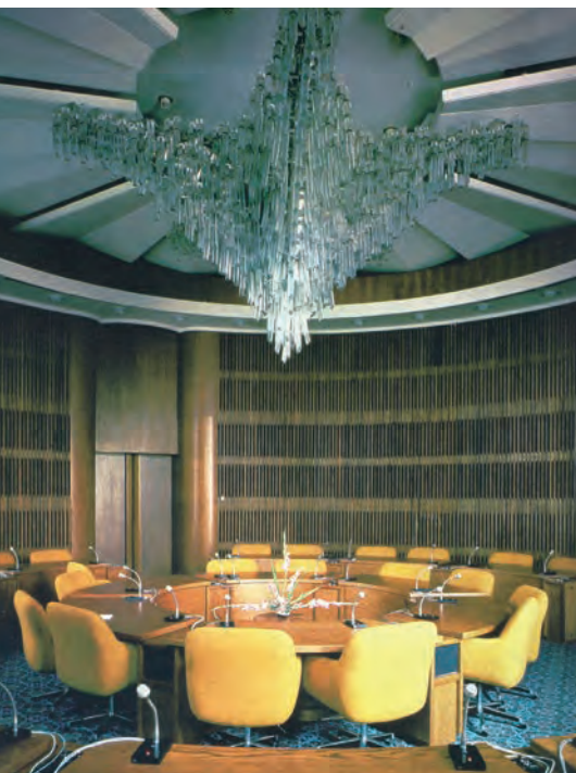
Obr. 13. Lustr v salonu hotelu Praha, návrh: Pavel Hlava, realizace: Crystalex, Nový Bor, 1980. (Publikováno v Glasrevue. Tschechoslowakische Zeitschrift für Glas und Keramik , 1983, roč. 38, č. 10, s. 12)