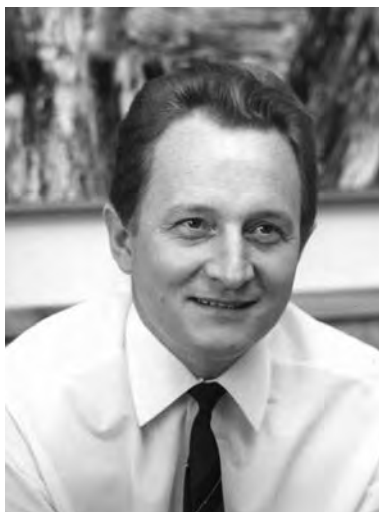
Obr. 1. Pavel Hlava, 50. léta 20. století.

Pavel Hlava se narodil 25. června 1924 v Semilech (obr. 1). Jeho práce je veřejností dobře známá, nikoliv ovšem podle jména, ale skrze dílo. Díky svému talentu a mimořádné pracovitosti se stal jednou z předních osobností českého skla, jemuž doslova zasvětil podstatnou část svého života. Doba jeho narození jako kdyby ho předurčila k jedinečné tvorbě ovlivněné převratnými událostmi českých dějin. Vynikal svým talentem a intelektem, oceňován je rovněž pro všestrannost na poli sklářské tvorby. Zasáhl do mnoha oborů od skla rytého, broušeného, malovaného, hutního, přes strojní sériovou výrobu až po realizace v architektuře.