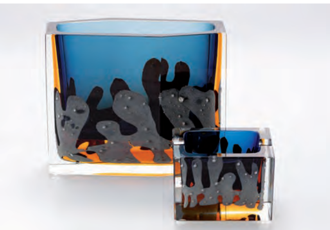
Obr. 8. Žardiniéra a popelník se zátavy, návrh: Pavel Hlava, realizace: Borské sklo (Exbor), Nový Bor, 1965. (Sbírka Muzea skla a bižuterie v Jablonci nad Nisou, foto Aleš Kosina)

návrhů vznikaly nejčastěji vázy a žardiniéry jednoduchých geometrických tvarů s nepravidelnými dekory tvořenými fóliemi. Pro tyto výrobky byla typická masivnost a tlumená barevnost v tónech hnědé, žluté a modré (obr. 8). O jejich mimořádné oblibě svědčí fakt, že se ve výrobním programu nástupnické firmy Crystalex držely ještě na konci 80. let 20. století. 8