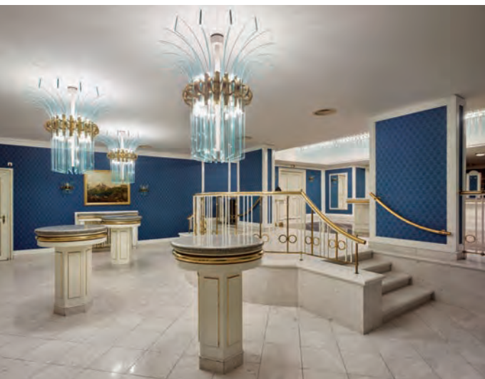
Obr. 16. Světelné objekty, bufet v přízemí Stavovského divadla, návrh: Pavel Hlava, 1990.