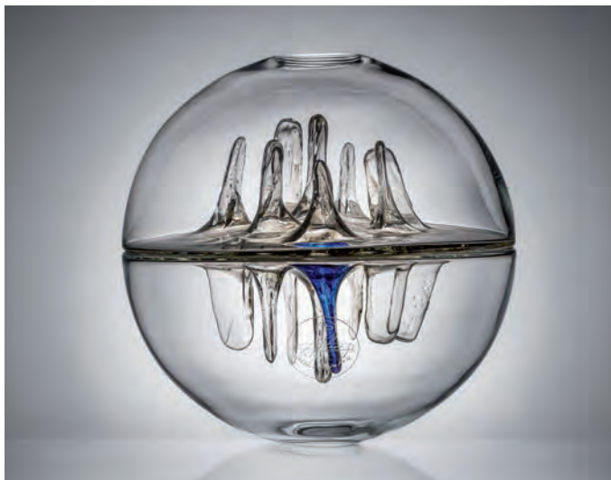
Obr. 18. Objekt s vnitřními vpichy, návrh: Pavel Hlava, realizace: Český křišťál, Chlum u Třeboně, závod Včelnička, 1972. (Sbírka Muzea skla a bižuterie v Jablonci nad Nisou, foto Aleš Kosina)

Protože měl Pavel Hlava velmi rád přírodu, stala se jeho největším inspiračním zdrojem. Skleněnou podobu dával jak obvyklým věcem nacházejícím se všude kolem, například plastiky Meloun (1990), Tulipán (1992), List (1994) či Kočka (1998), tak