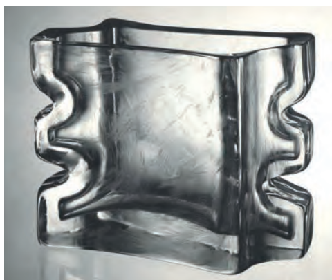
Obr. 10. Váza, broušená a rytá, návrh: Pavel Hlava, realizace: Sklárny Bohemia, Poděbrady, kolem 1970.