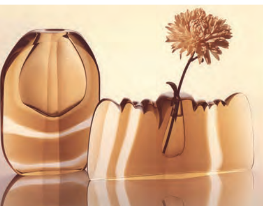
Obr. 9. Vázy, návrh: Pavel Hlava, realizace: Karlovarské sklo, Karlovy Vary, kolem 1970.

Koncem 60. let 20. století Pavel Hlava opět pracoval na broušených vázách s úzkým otvorem. Rozpracoval je v návrzích pro Karlovarské sklo. Změnou oproti těm, které vznikaly v Novém Boru, byly zvlněné linie předmětů s využitím jemnějších barevných prvků (obr. 9). Ve stejném období se věnoval také rytému sklu ve sklárnách Bohemia v Poděbradech. Tentokrát stěny předmětů zdobily abstraktní struktury v zajímavé kombinaci s hladkými leštěnými plochami (obr. 10).