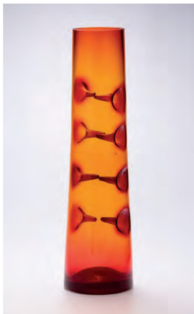
Obr. 6. Váza s vnitřními vpichy, návrh: Pavel Hlava, realizace: Český křišťál, Chlum u Třeboně, závod Včelnička, 1960. (Sbírka Muzea skla a bižuterie v Jablonci nad Nisou)