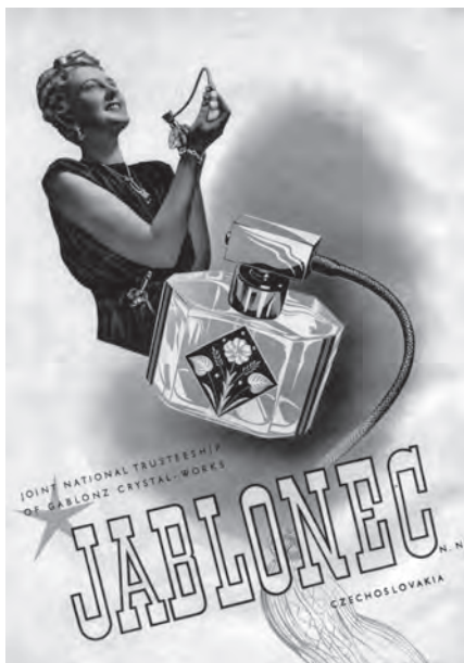
Inzerát z roku 1947

valy pod původními nebo počestnými názvy (například v podobě přeložených křestních jmen původních českoněmeckých majitelů).