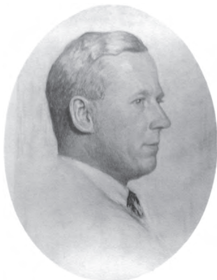
Walter Riedel, fotografická reprodukce obrazu, soukromá sbírka

Celý katalog je přitom zřetelně koncipován a sepsán tak, aby přinesl potřebné informace nejen návštěvníkům, ale i novým řídicím elitám. Svědčí o tom například v kontextu se soudobým „slučovacím étosem“ pozoruhodná Bergerova apologetika decentralizace jako nezbytného předpokladu efektivity: „Jedním z předpokladů dobré správy a organizace je zjednodušení celé dnešní struktury veřejných, průmyslových a hospodářských institucí při vhodné decentralizaci správního aparátu. Musíme bezpodmínečně a co nejrychleji zlikvidovat všechny přebytečné orgány a komise, převzaté z protektorátu