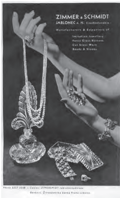
Inzerát z roku 1947

a komplikující chod našeho života. Musíme se však zbavit také zbytečných orgánů, které nabývaly v prvých dobách našeho života a jež jsou dnes luxusem a přítěží. Povede to k podstatnému zlevnění výroby, k snížení režie, ušetření sil a nervů, jimiž se teď zbytečně plýtvá na množství nemožných porad a konferencí. (...) Další takový předpoklad je řádný pracovní a výrobní plán a opravdové plánovitě hospodářství, jež bude moci počítat se skutečností a nikoliv s hypotézami.“ [31]