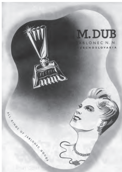
Inzerát z roku 1947

je z mála těch šťastných vývozních oborů, kde po téměř 7 leté válečné přestávce může být obchod po sdělení mírových smluv okamžitě zahájen, a to jak hotových skladů zboží, které jsou podstatné, tak z nové výroby, jež byla právě povolena, a jež nepotřebuje k zahájení prozatím nic jiného než uhlí a nějaké méně významné suroviny skoro vesměs domácí“ [14] .