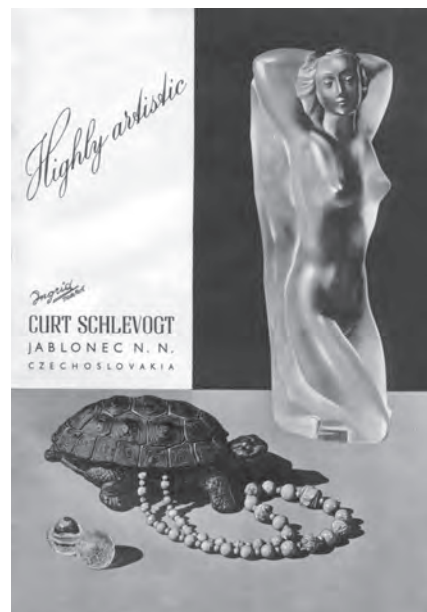
Inzerát z roku 1947