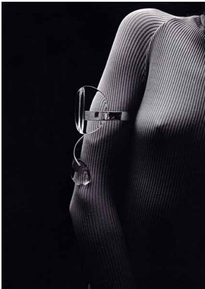
Náramek na paži, olovnatý křišťál, rhodiovaná mosaz, 1972