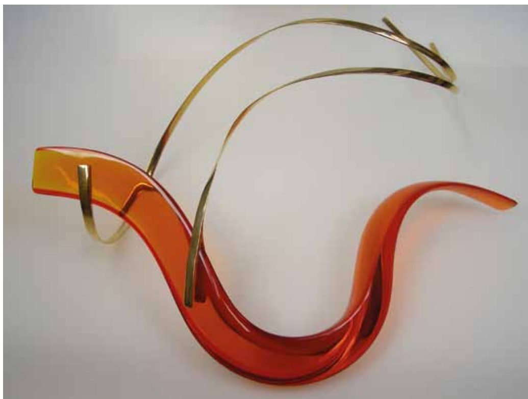
Náhrdelník, broušené sklo, zlacená mosaz, 1982–1990, sbírka Muzea skla a bižuterie v Jablonci nad Nisou

24_Lovers from Prague. Czech jewellery. World Jewellery Museum Seoul. 2010. [katalog výstavy, volný překlad]