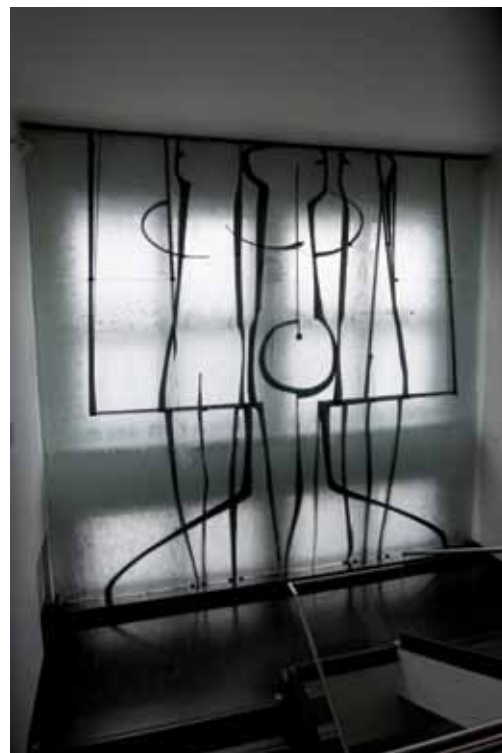
Vitráž, bývalé ředitelství n. p. Železnobrodské sklo (nyní firma Detesk), Železný Brod, leptané tabulové sklo, ocelový kov, 8 m 2 , 1967, foto Jakub Kalousek

Od poloviny 60. let se autor začal také účastnit skupinových výstav 11 a v roce 1971 byly jeho práce vybrány na prestižní výstavní přehlídku současného evropského šperku Internationale Schmuckschau, která se tra-