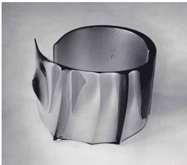
Náramek na paži, broušené sklo, rhodiovaná mosaz, 1974