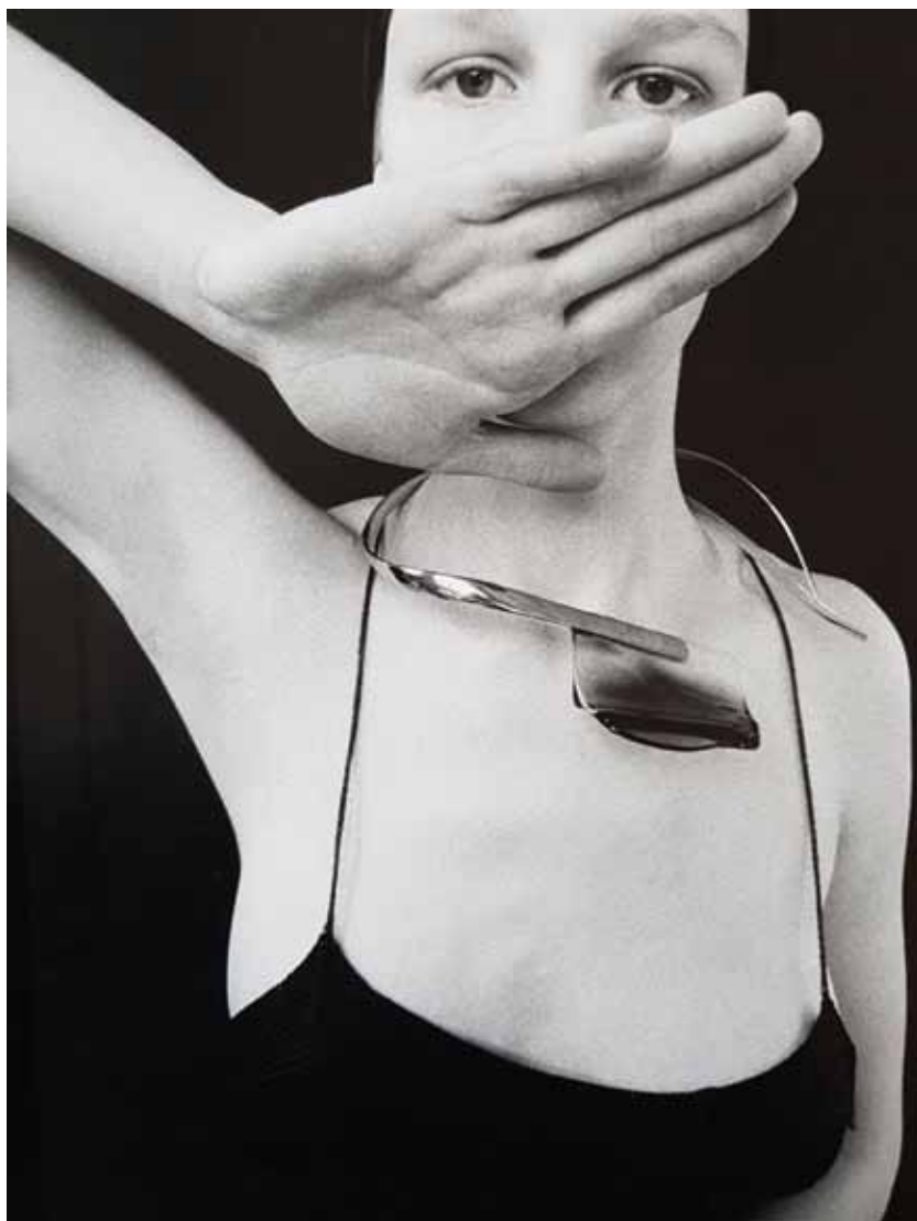
Náhrdelník, broušené sklo, rhodiovaná mosaz, 1975

kteří o českém autorském šperku v tehdejší Československu vycházely. 15 Hlavní text se objevuje v drobné publikaci „Současný český šperk“ z roku 1979. Zde jeho práce autorka textu Věra Vokáčová řadí k volnému umění, které na první pohled „ může prokázat svébytnou existenci ve smyslu object d'art, přece je autor koncipuje v závislosti na tvarosloví ženského těla, nikoli oděvu, bez konvenčního omezení. Neváhá vytvořit šperk na nohu nebo na nahé tělo... Náročná práce předpokládá náročnou nositelku. “ 16