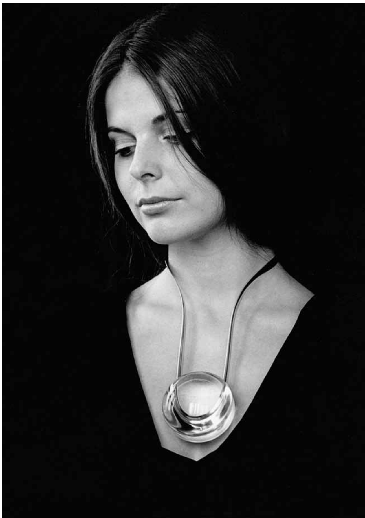
Náhrdelník, broušené organické sklo, rhodiovaná mosaz, 1975