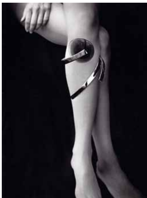
Šperk na lýtko, broušené sklo, rhodiovaná mosaz, 1972, sbírka Uměleckoprůmyslového musea v Praze

Kasalého výtvarného experimentování a snažení. V této době teoretici umění ještě v mnoha textech polemizovali o rozdílech mezi ateliérovou bižuterií a autorským uměleckým šperkem. Kasalého tvorba podle jejich hodnocení zcela jasně překročila ustálené a vžitě konvence a „ migruje z oblasti volného do oblasti užitého projevu a naopak “. Byla jasně zhodnocena jako autorský šperk i přesto, že jej nevytvářel z drahého kovu. Manželé Holešoviští vychvalují zejména jeho řemeslné mistrovství a dokonalé zvládnutí techniky zpracování skla i kovu.