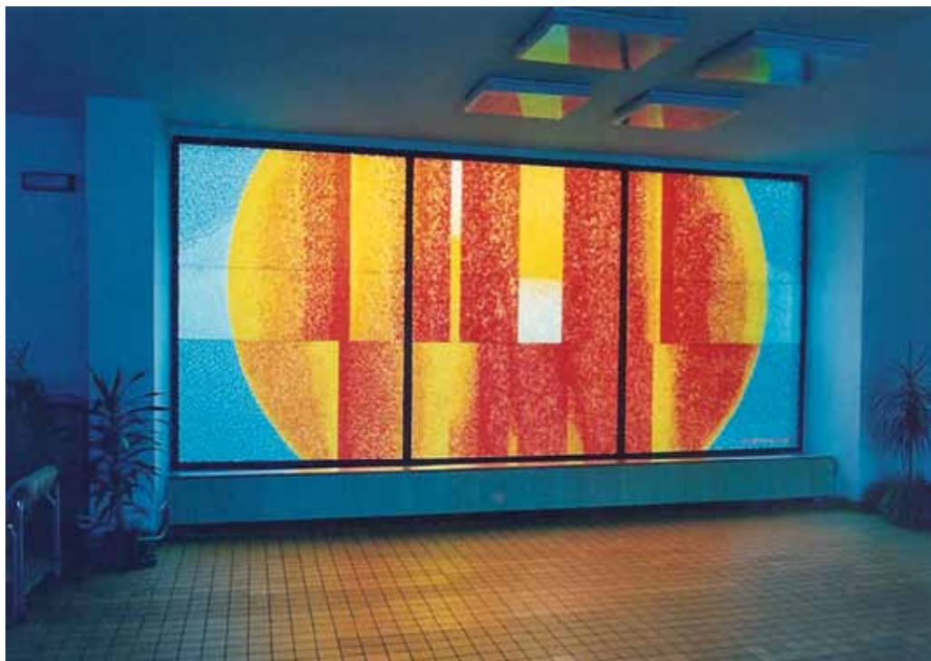
Skleněná mozaika natavená na skle, Žákovský domov Modeta Jihlava, vstupní prostor, 12 m 2 , 1982, foto archiv autora

Po maturitě se proto rozhodl zůstat v železnobrodském údolí, kde se koncentrovala sklářská kreativní síla nejen kolem odborné školy a jejích studentů i absolventů, ale také mezi zde žijícími a tvořícími sklářskými výtvarníky. Tady se také oženil, založil rodinu a vybudoval si první brusičskou dílnu a ateliér. 4