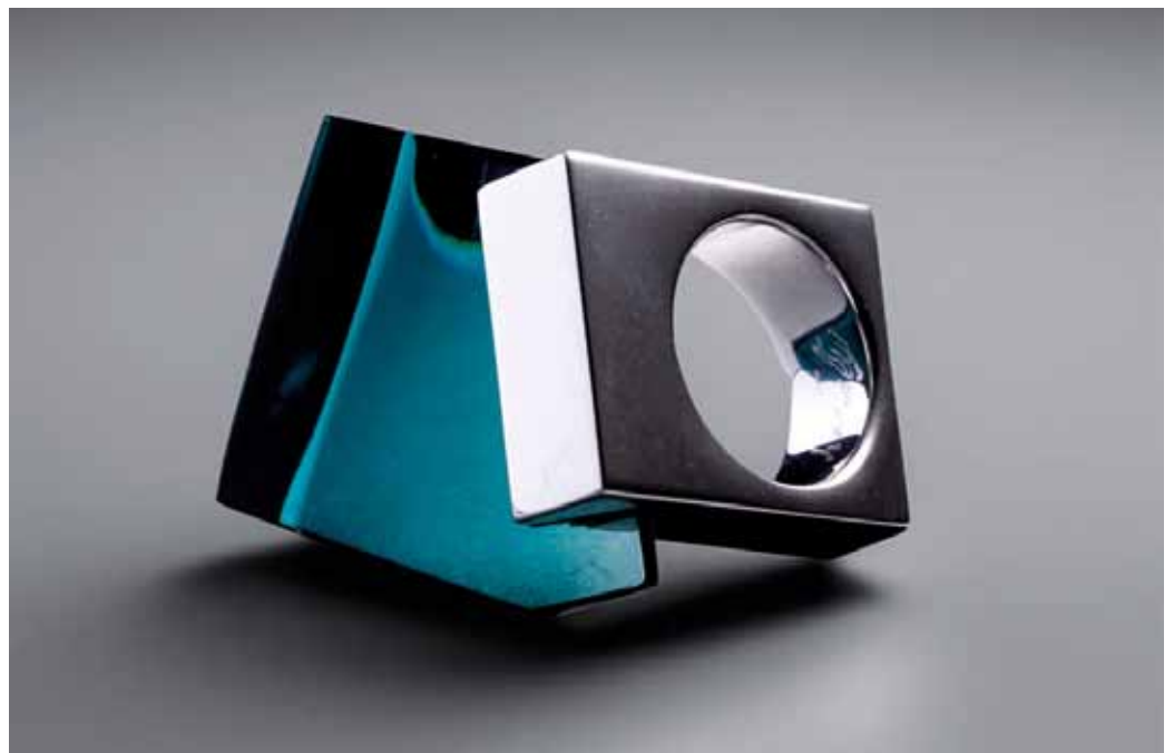
Prsten, broušené sklo, rhodiovaná mosaz, 2006