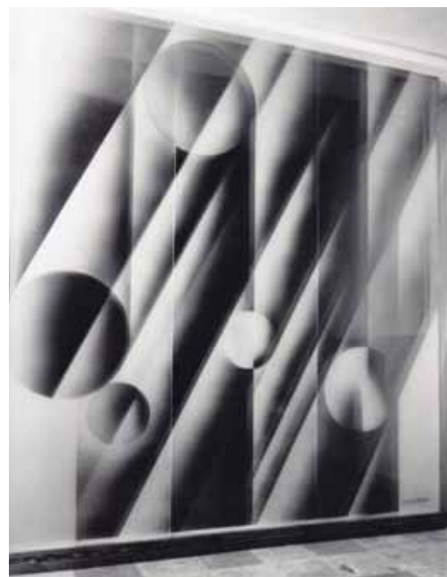
Vitráž, ředitelství Plynáren, Jihlava, pískované sklo, 22 m 2 , 1985, foto archiv autora