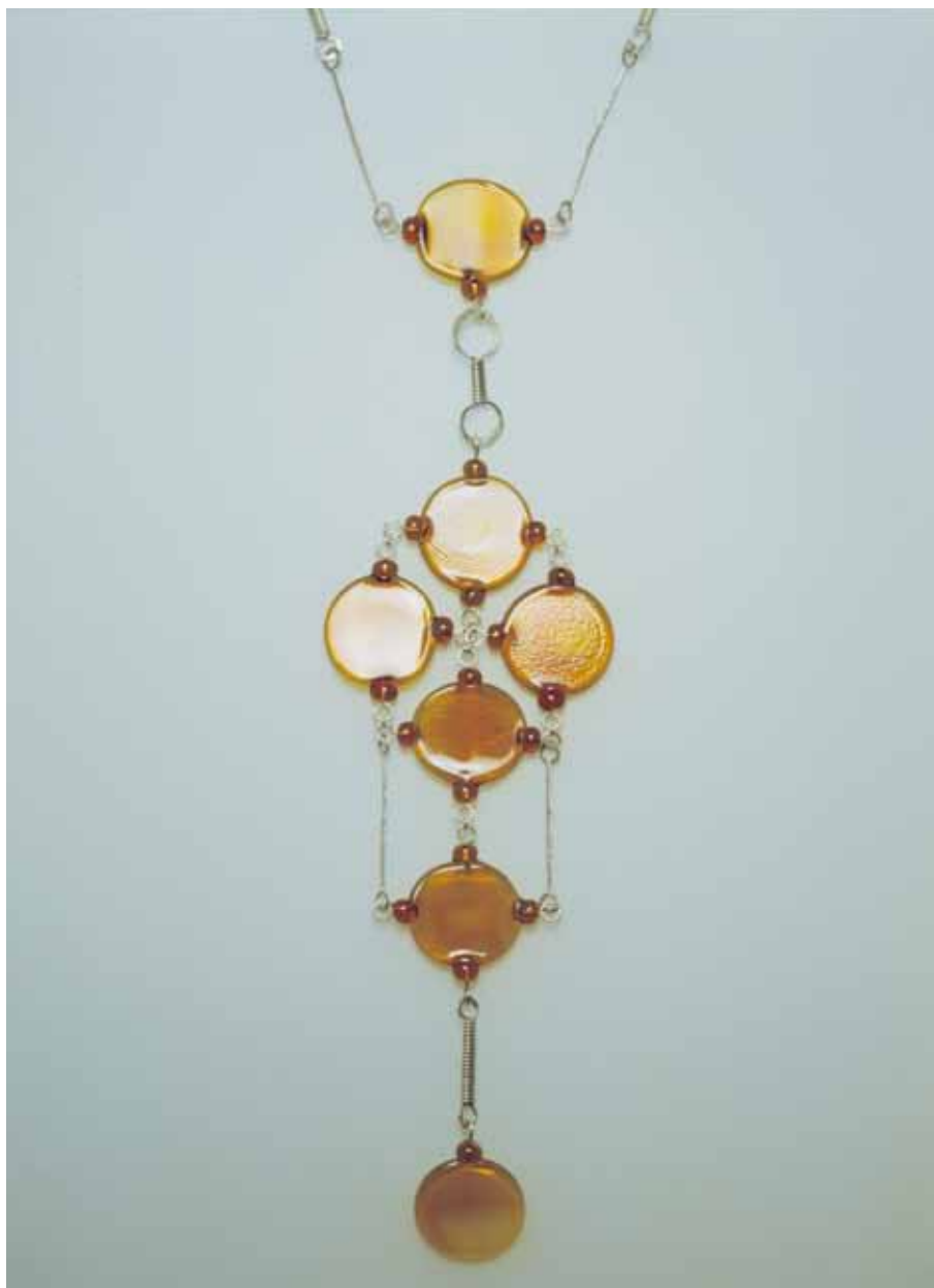
Náhrdelník, stříbro, sklo, 1966 – 67

1_Recenzovaný odborný článek vznikl na základě institucionální podpory dlouhodobého koncepčního rozvoje výzkumné organizace Muzeum skla a bižuterie v Jablonci nad Nisou poskytované Ministerstvem kultury ČR.