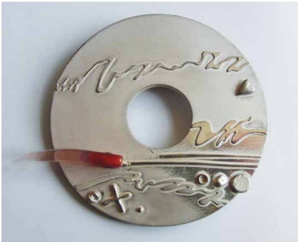
Brož, stříbro, sklo, 1985, foto archiv MSB, sbírka MSB

mické vlastnosti materiálu. Kodejš se zde zabývá specifickou povrchovou strukturou stříbrného kovu, který někdy kombinuje také s ocelí nebo tombakem. Struktury docílíje matováním, patinováním, provrtáváním, prořezáváním či vrstvením stříbra a vytváří harmonickou sérii šperků. Autorův šperk je plně podřízen zákonům nositelnosti, můžeme v něm sledovat i jisté ovlivnění některými proudy volného umění. Jeho tvorba tak v tomto období v sobě slučuje prvky informelu, lettrismu či strukturalismu.