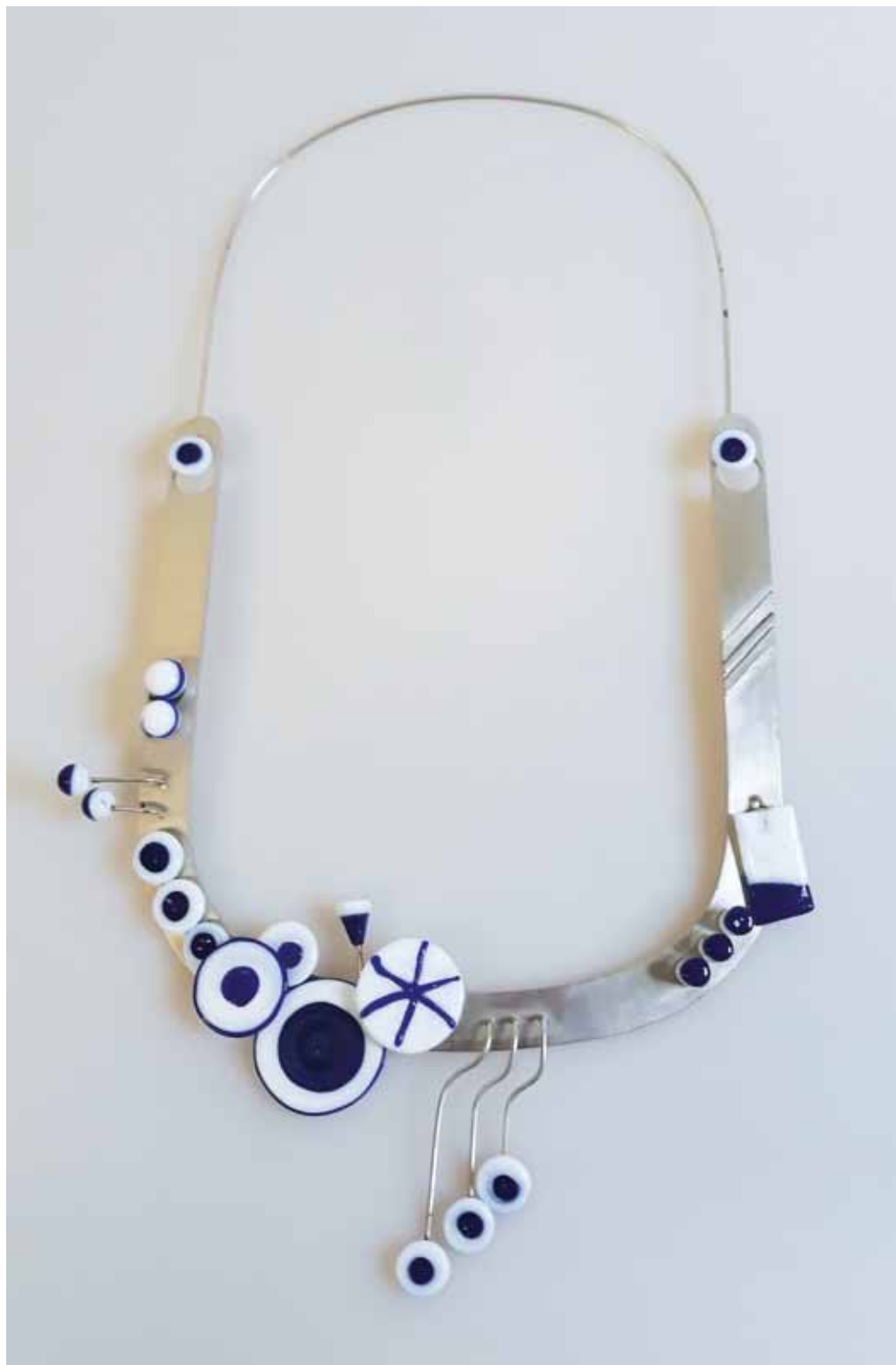
Náhrdelník, stříbro, sklo, 1977, bronzová medaile na Mezinárodní výstavě bižuterie Jablonec '77, sbírka MSB