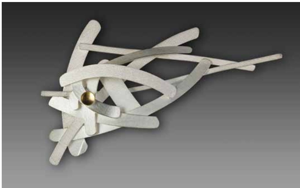
Brož, stříbro, 2012

inspiraci všude kolem sebe. Zejména v krajině a přírodě, v nadhledu, ale i v mikrosvětě. Ze střídání rytmů a blízkých či vzdálenějších pohledů na svět kolem vznikaly všechny jeho šperky, v nichž zúročil svůj výtvarný talent, řemeslný um a preciznost.