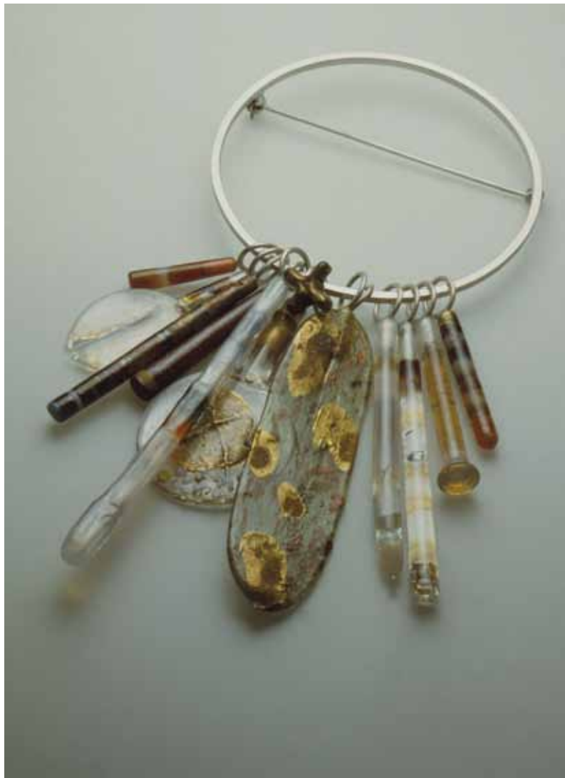
Brož, stříbro, sklo, 1984, archiv autora.

Od druhé poloviny osmdesátých let se jeho tvorba začíná ubírat jiným směrem. Zejména v brožích, ale také v některých náhrdelnicích využívá sklo jen jako doplňkový barevný akcent a pro jiné série z tohoto období nevyužívá sklo vůbec. Vzniklo tak mnoho zajímavých variant, přičemž jejich někdy i velmi křiklavou barevnost ovlivňovala autorova momentální nálada nebo také fyzikální a che-