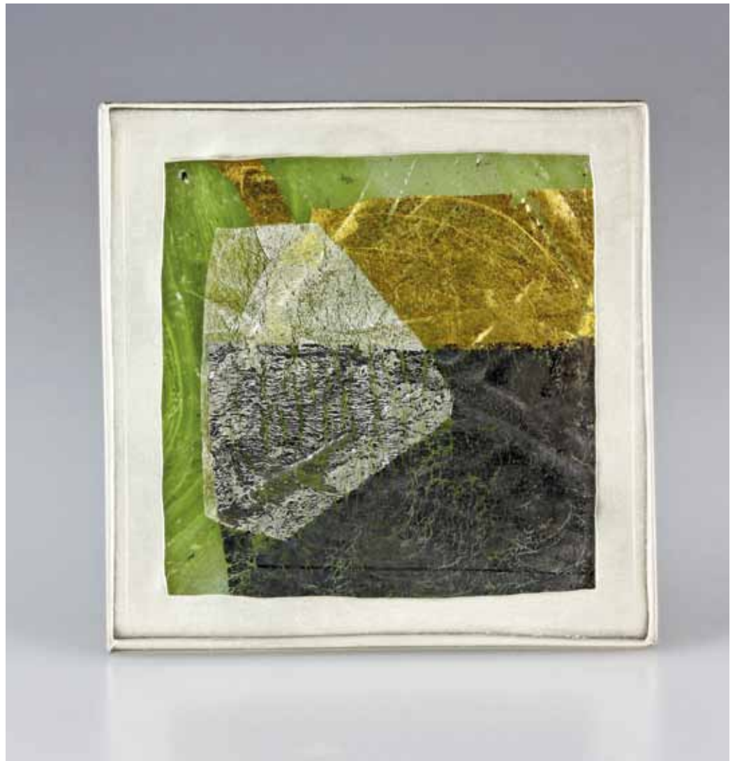
Brož, sklo, pigmenty kovů, 2010