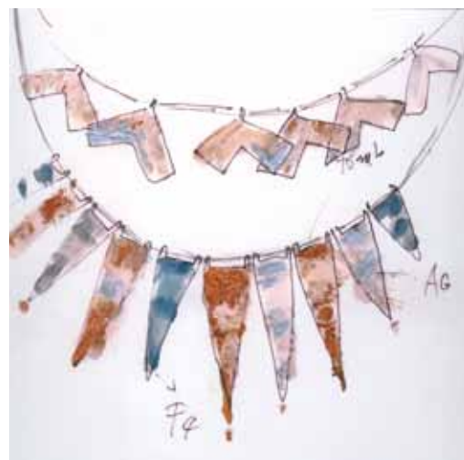
Skicy náhrdelníků, kolem 2010