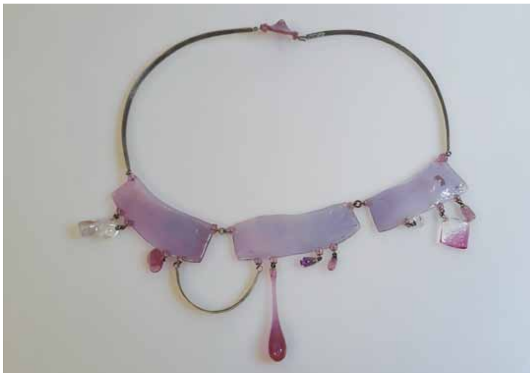
Náhrdelník, stříbro, sklo, 1968, Sympozium Stříbrný šperk Jablonec '68, foto archiv MSB, sbírka MSB