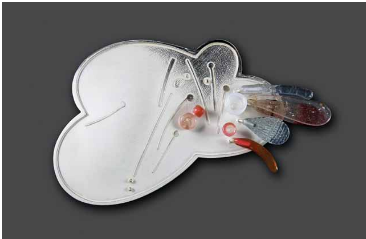
Brož, stříbro, sklo, 1977