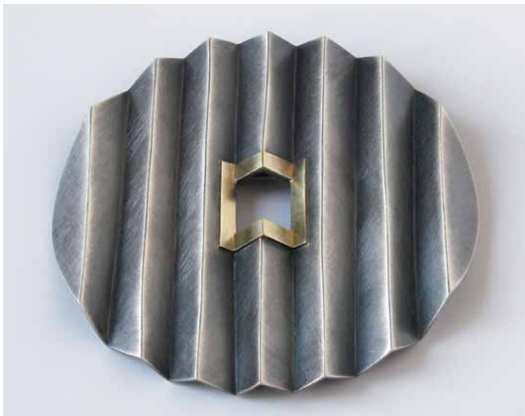
Brož, stříbro, zlacené stříbro, 1990

V další sérii Kodejšových broží vytváří hlavní akcent slinované lehané sklo s barevnými zlatými, měděnými nebo jinak probarvenými pigmenty. Povrchová struktura se propojuje spolu s patinovaným stříbrem do jednoduchých geometrických útvarů – většinou kruhů a čtverců, které působí jako miniaturní rámy obrazů nebo jako samotné abstraktní obrazy s vlastním vnitřním životem. Tyto šperky snad nevíce vycházejí z autorových obrazů