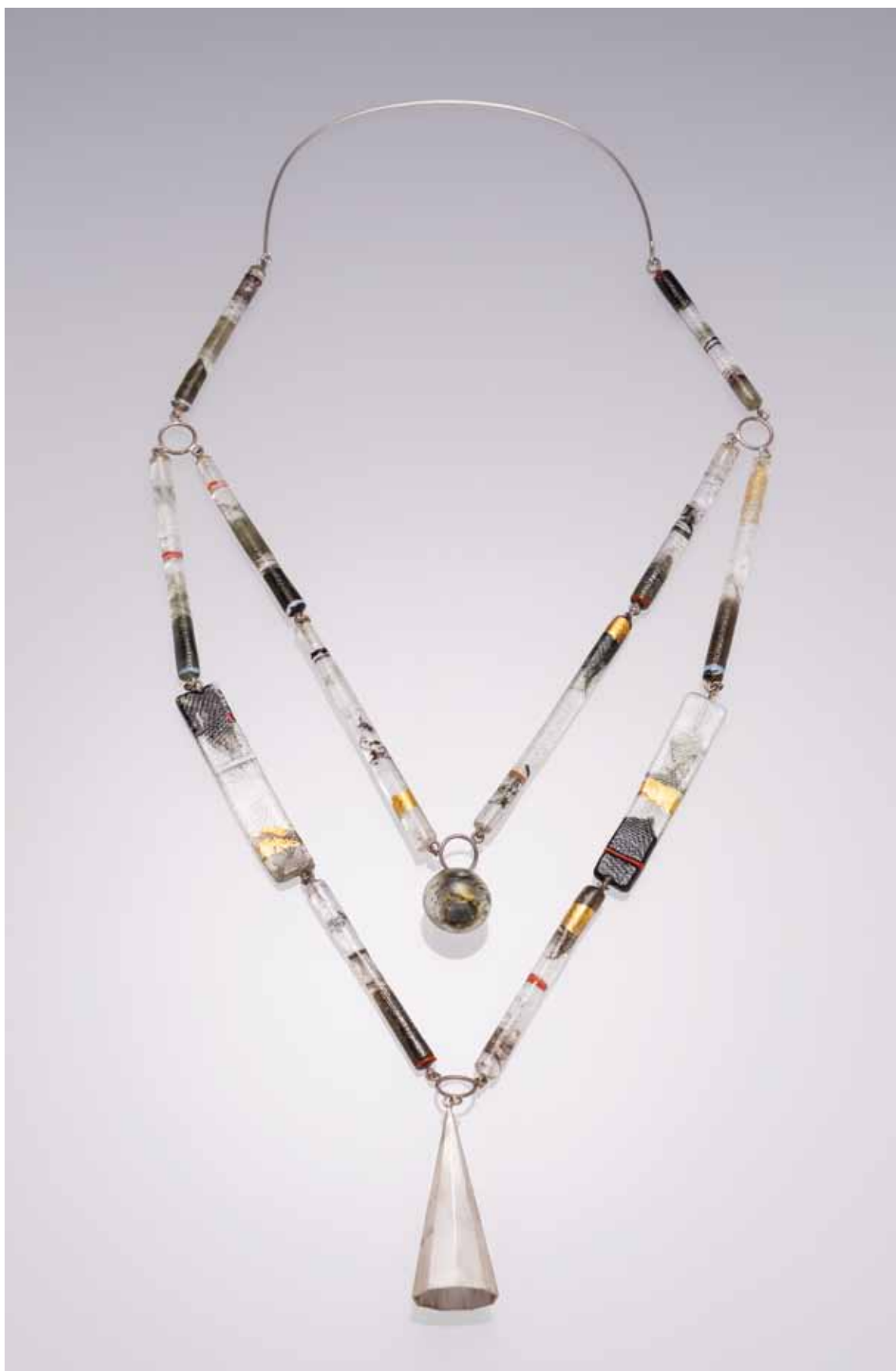
Náhrdelník, sklo, stříbro, 2008.