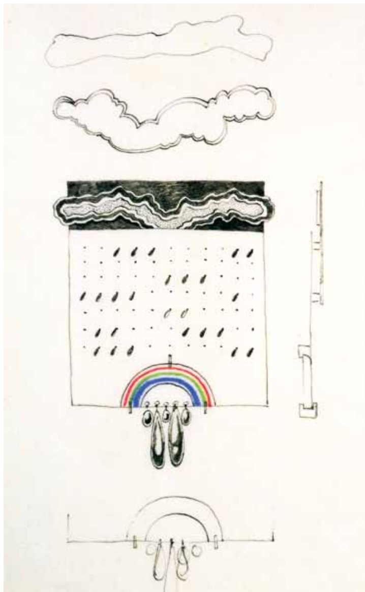
Skica k broži, kolem 1975