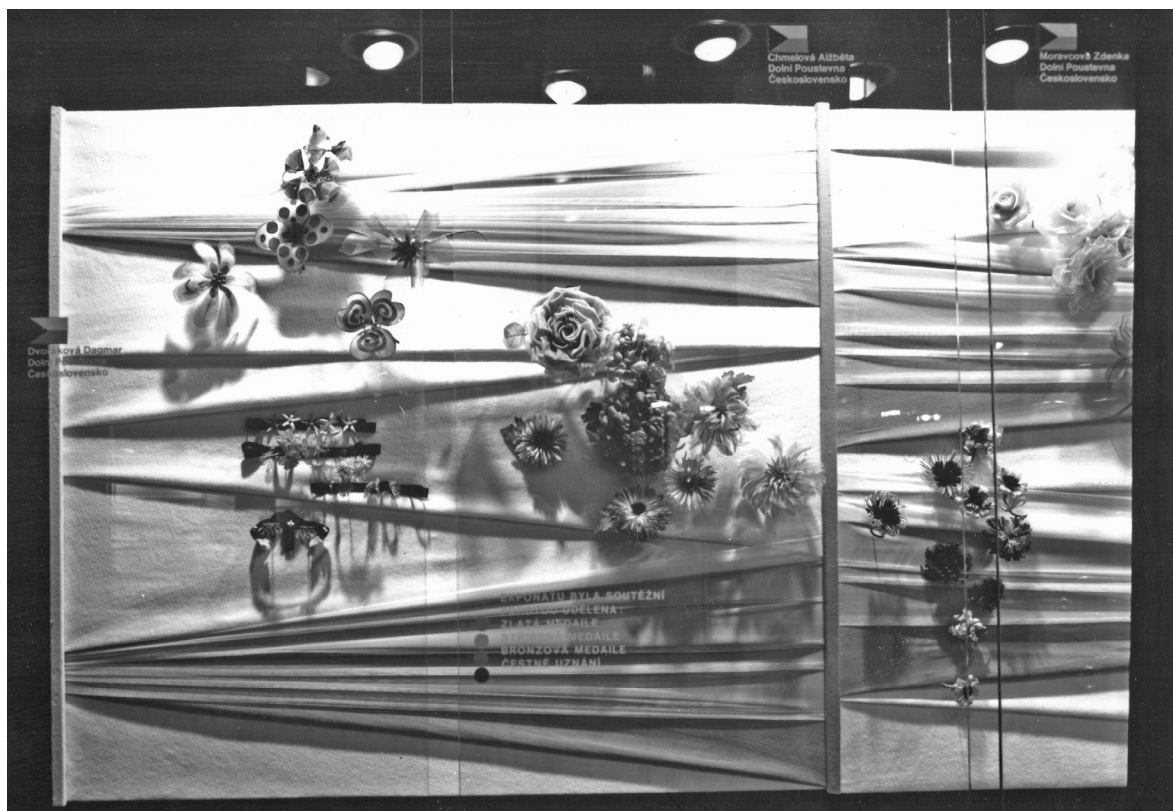
Obr. 5: První zleva kolekce Dagmar Dvořákové, Mezinárodní výstava bižuterie Jablonec 77, Expozice individuální bižuterie Muzeum skla a bižuterie v Jablonci nad Nisou, knihovna