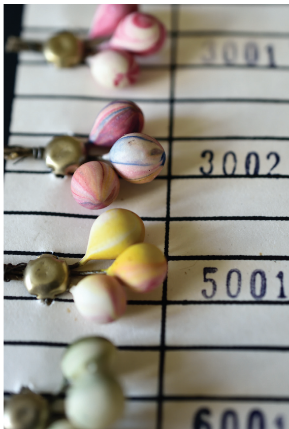
Obr. 4: Vzorkovnicová karta melírovaných pestiků – zlepšovateľský návrh D. Dvořákové a J. Javorovského.