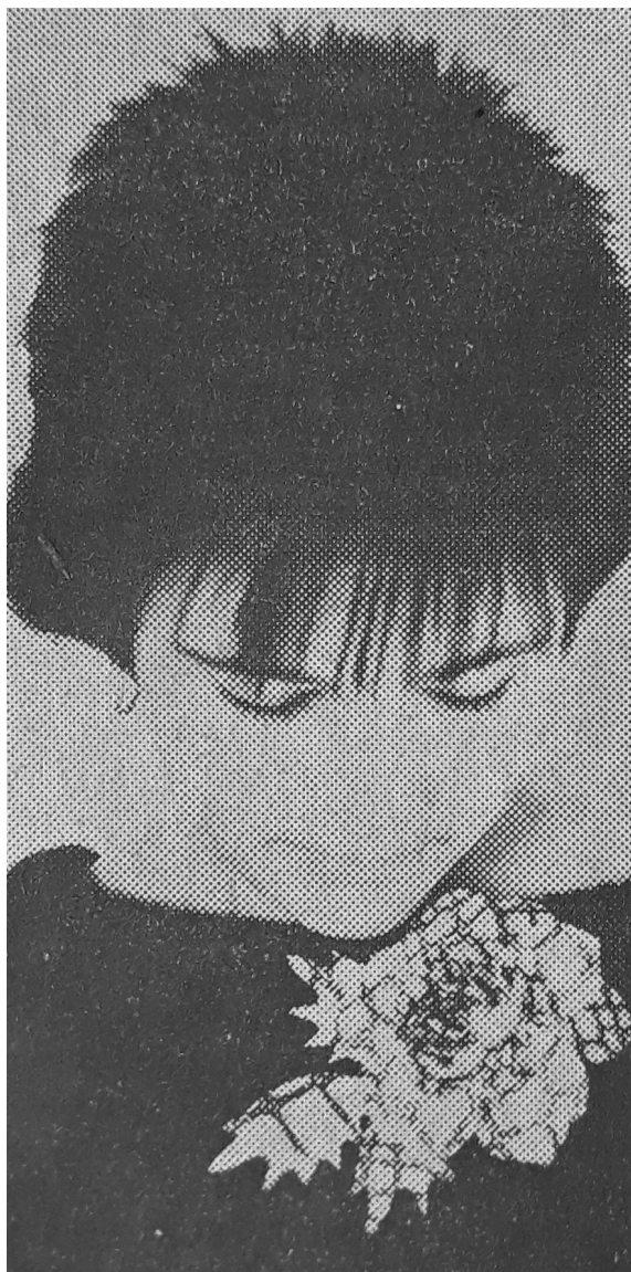
Obr. 10: Šatová ozdoba z oceněné kolekce (Anonymní výtvarná vnitrokoncernová soutěž, 1989), polyester, sítotisk.