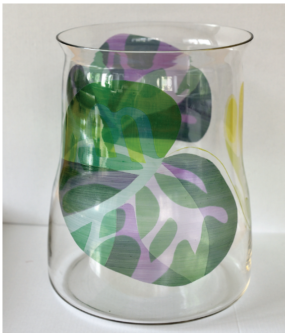
Obr. 1: Váza, malované sklo, soukromá sbírka. Foto: K. Hrušková, 2021