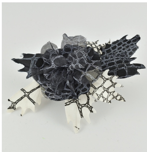
Obr. 9: Šatová ozdoba, atlas, čínské hedvábí, univera (šifon), sítotisk, MSB. Foto: K. Hrušková, 2021

Řadu oceněných vzorků získala i v rámci podnikových soutěží. V letech 1983, 1984, 1986 a 1989 byly její vzorky oceněny i jako nejlepší výrobky koncernu. V případě Anonymní výtvarně-technické soutěže to bylo v letech 1982, 1984 za zmíněné melírované pestíky a roku 1985 uspěla ve třech různých kategoriích. O rok později slavila úspěch kolekce drobných dárkových krabiček s názvem NOSTALGIE (obr. 7), kde poprvé využila látku dekorovanou sítotiskem. Oceněná byla i realistická orchidej, vzor CATLEYA. V roce 1987 hodnotící komisi naopak zaujala fantazijní šatovka MADEIRA, dekorovaná potiskem, který svým vzhledem připomínal dřevo. V roce 1988 byla po úspěchu v anonymní výtvarně-technické soutěži vybrána kolekce „Šatová móda“ do prestižní soutěže Ministerstva průmyslu a obchodu ČSR o Průmyslový výrobek roku.