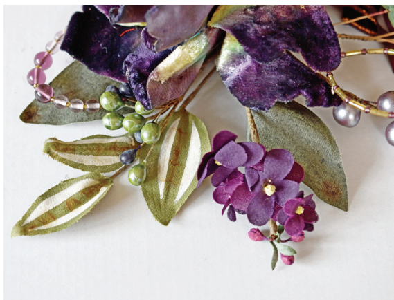
Obr. 2: Ukázka dekorace listů pomocí razítek, soukromá sbírka.