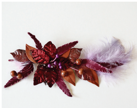
Obr. 8: Šatová ozdoba z kolekce „ŠATOVÁ MÓDA“, samet, kůže, peří, dřevo, drát obtočený papírem, Průmyslový výrobek roku 1988, soukromá sbírka.

Po rozdělení státního podniku Centroflor v roce 1990 23 pokračovala v rámci nástupnického podniku Novaflor, a to do roku 1992. Zde vytvořila jednak kolekci svatebních dekorací, ale také kolekci v tzv. akcentních barvách pracující opět se sítotiskem, která ale nebyla bohužel výrobně uznána. Po odchodu z Novafloru se vrátila ke své vystudované profesi malování skla, a to v rodinné firmě D STYL.