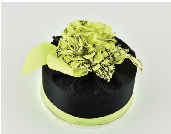
Obr. 7: Dárková krabička z kolekce NOSTALGIE, plastická hmota, polyester, dekorováno sítotiskem, taftová stuha, MSB. Foto: K. Hrušková, 2021