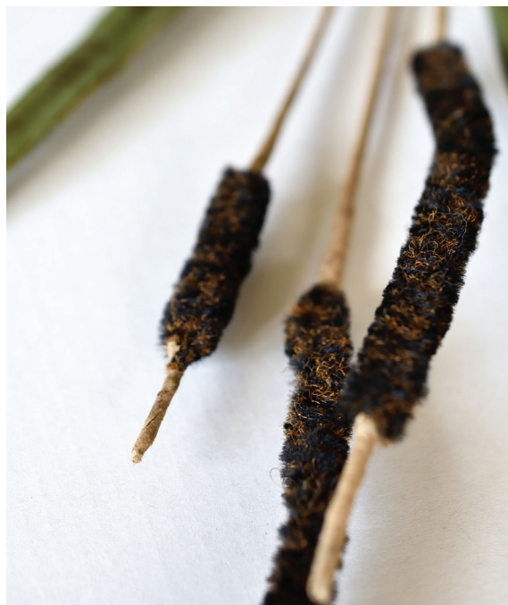
Obr. 3: Tráva, žinylka, textil, drát, papír, soukromá sbírka. Foto: K. Hrušková, 2021

Dalším dekoracním postupem, který se u Dagmar Dvořákové objevoval, bylo vrstvení textilií. Místo potisku nebo malby na látku vysekávala tvary, které se následně lepily na sebe. Díky tomu mohly vznikat jednak originální dekory, a především také kombinace neobvyklých materiálů. Vzorčky využívající sekundární dekorace materiálů se nicméně do výroby nedostaly, a byly zachovány jen jako prototypy úspěšné například ve výstavní nebo soutěžní rovině. To proto, že byly obtížně zařaditelné do velkosériové výroby. Nutno ale podotknout, že v rámci VHJ PJB se to stejné dělo i s řadou inovativních vzorů v bižuterních odvětvích. Obecně byla výstavní a soutěžní tvorba, užívaná pro podnikovou reprezentaci, odlišná od uznávaných vzorků pro skutečnou výrobu. Roli v tom hrály i požadavky zákazníků, u kterých často zvítězila cena nad estetikou.