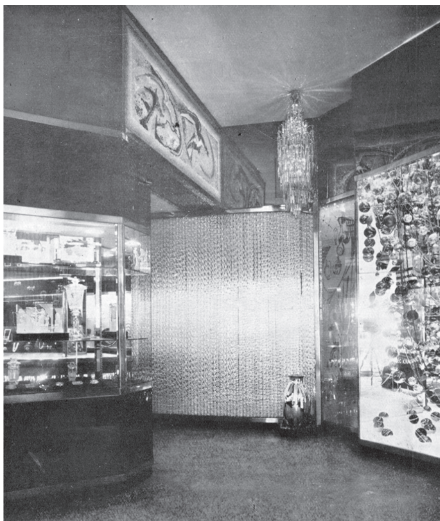
Pohled do čs. expozice na světové výstavě v Paříži, 1937 – uprostřed dekorace z bižuterních tyčí dodaná firmou Jos. Riedel, Dolní Polubný podle návrhu Antonína Heythuma, reprodukce z dobového časopisu

V květnu 1945 Německo prohrálo válku a do Jizerských hor přišla Rudá armáda. Československo bylo obnoveno téměř v původních hranicích, když muselo Sovětskému Svazu přenechat Pod-