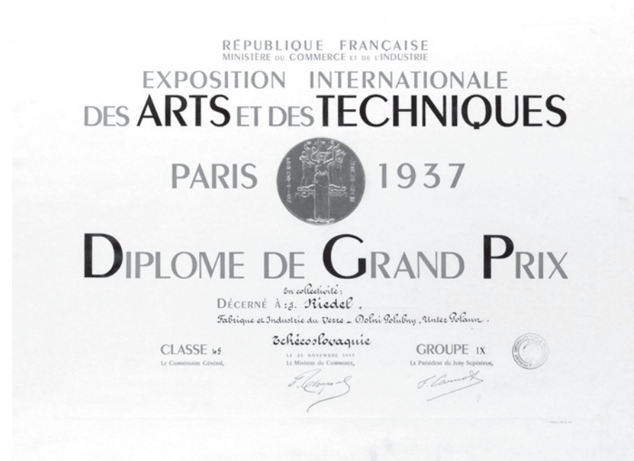
Diplom Grand Prix pro firmu Jos. Riedel, Dolní Polubný, ze světové výstavy v Paříži, 1937