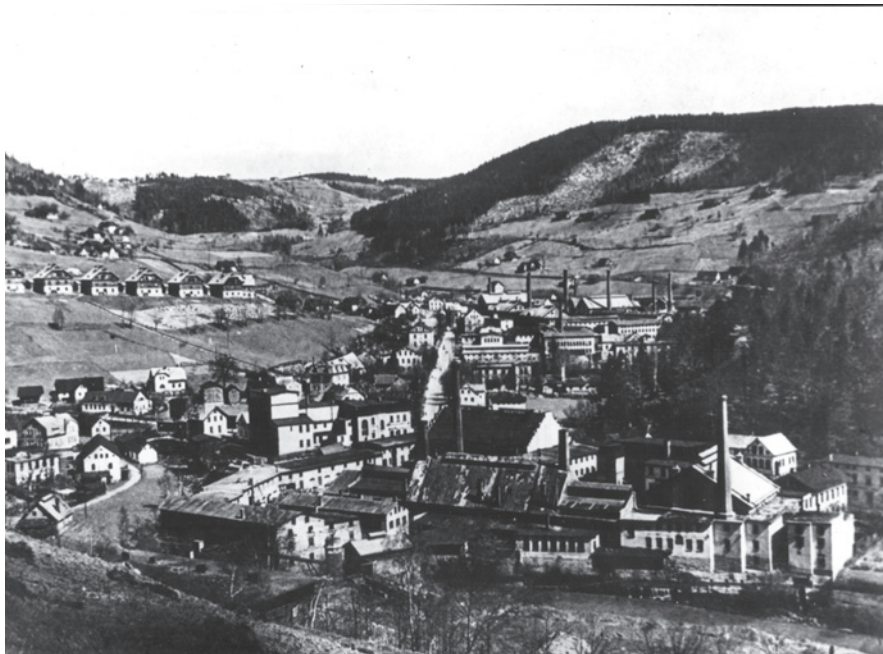
Pohled na komplex riedelovských skláren v Dolním Polubném a na Příchovicích, kolem 1940, dobová reprodukce

Recenzovaný odborný článek vznikl na základě institucionální podpory dlouhodobého koncepčního rozvoje výzkumné organizace Muzeum skla a bižuterie v Jablonci nad Nisou poskytované Ministerstvem kultury ČR.