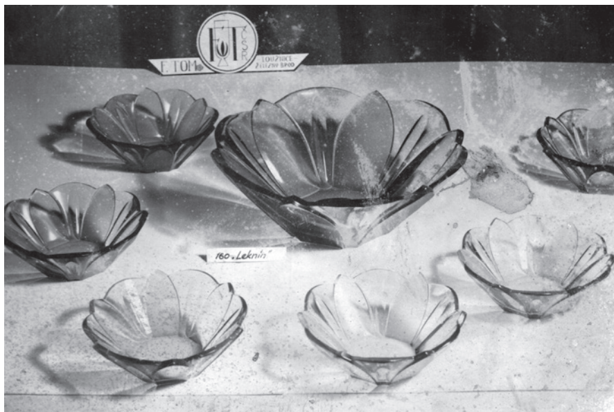
Vzorková reklamní, fotografie, firma F. Tom, Loužnice, 30. léta 20. století