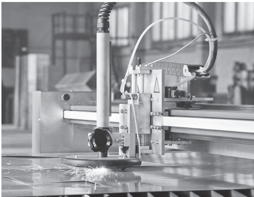
Brousíací zařízení, Polpur, Turnov

vrhl Bjoern Norgaard. Jedná se o jednu z největších skleněných plastik na světě, jež vznikala mezi lety 2016–18. V roce 2014 Lhotský se svým týmem vyvinul též efektní patentovanou techniku taveného skla Vitrucell, s níž experimentoval dvacet let [20] .