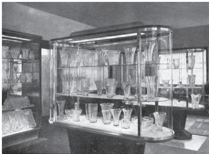
Vzorkovna firmy Rudolf Hloušek v Železném Brodě, kolem 1938

Hodnota společnosti na konci roku 1947, kdy zaměstnávala na 30 lidí, byla 2 miliony Kč. Po komunistickém únorovém převratu firma neunikla znárodnění a začlenění do národního podniku Železnobrodské sklo. Nebyl