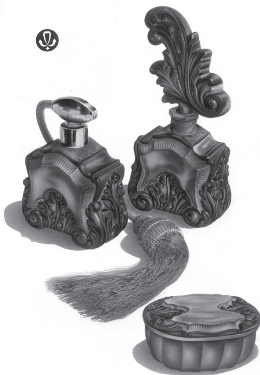
Toaletní souprava, reliéfně lisované sklo, firma František Halama, Železný Brod, po 1937, sbírka MSB v Jablonci nad Nisou (reprodukce ze vzorníku Skloexportu z 60. let 20. století)