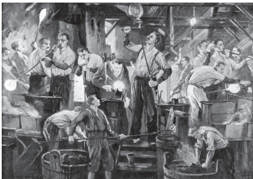
Eduard Enzmann, Polubenská huť, olej na plátně, 1927 sbírka MSB