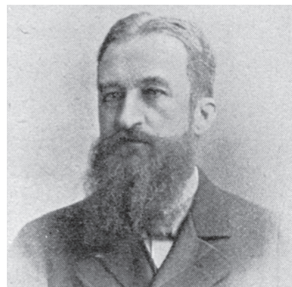
Wilhelm Riedel, před 1912, fotografie z dobové publikace

Ve středu riedelovského zájmu ale samozřejmě zůstaly bižuterní polotovary. Mezi lety 1898/1899 vyrostla na Příchovicích již třetí sklárna na výrobu skleněných tyčí (tzv. Kaschelhütte). Ve dvoře značně rozšířená – od roku 1897 elektrifikovaná – polubenské rafinerie firma zřídila moderní hygienické zázemí pro zaměstnance – dvě vany a čtrnáct sprch se studenou i teplou vodou. Skutečné firemní lázně v Kořenově Riedelové roku 1899 nechali přestavět na luxusní hotel s dvanácti pokoji.