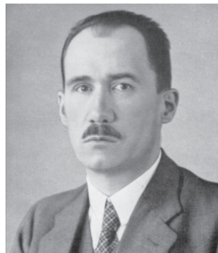
Senioršéf Otto Riedel ml. (1881–1934), portrét ní fotografie z nekrologu

Rostla též síť firemních zastoupení po celém světě. Jako před válkou je i nadále provozovali místní partneři, kteří