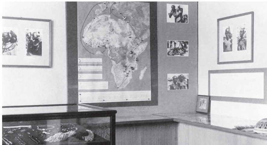
Z expozice muzea, 1958

V roce 1953 se jablonecké muzeum stalo součástí Národního technického muzea v Praze a jeho novým hlavním úkolem dokumentovat sklářskou a bižuterní technologii. Změnil se samozřejmě i název, a to na Národní technické muzeum v Praze, pobočka v Jablonci nad Nisou . Toto neradostné období skončilo roku 1961, kdy se muzeum znovu osamostatnilo, když se jeho zřizovatelem stal jablonecký okres. Vzniklo tak Muzeum skla a bižuterie v Jablonci nad Nisou ,