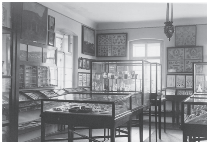
Z expozice muzea, 1911

Na podzim roku 1945 muzeum převzala česká správa a znovu jej otevřela pod názvem Muzeum města Jablonce nad Ni-