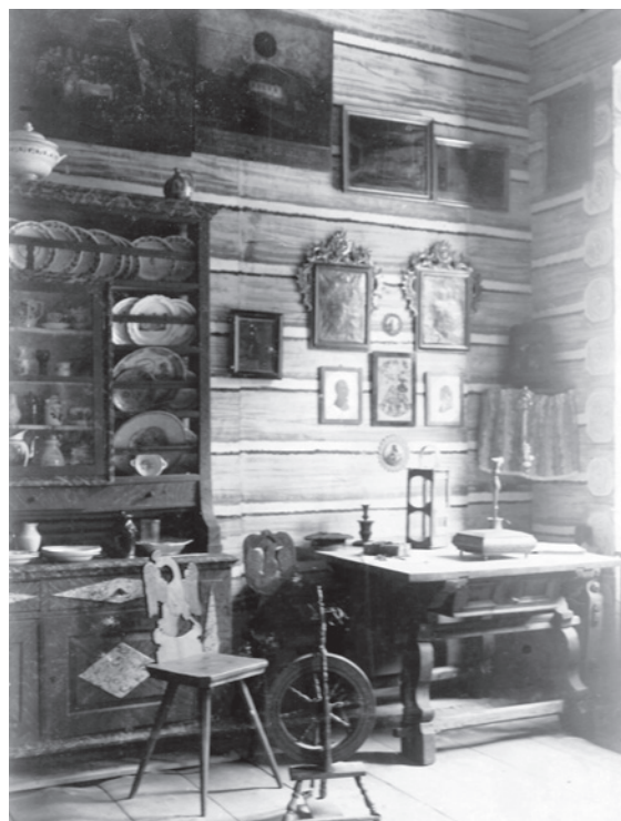
Z první expozice muzea, 1904

Jablonecké muzeum zřizované Ministerstvem kultury České republiky spravuje největší kolekci bižuterie na světě (více než 12 milionů kusů) a jednu z největších evropských veřejných sbírek skla (více než 10 tisíc evidenčních čísel a zhruba 16 tisíc kusů vánočních ozdob). V letošním roce si připomíná 115 výročí, a to je jistě dobrá příležitost krátce si připomenout jeho historii a současnost.