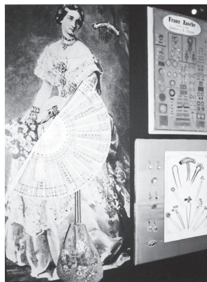
Z expozice muzea, 1995