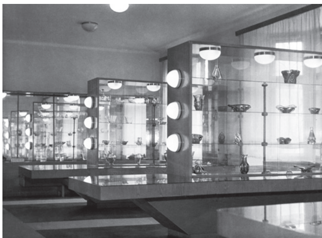
Z expozice muzea, 1958