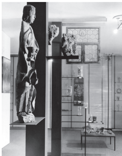
Z expozice muzea, 1964

prošla náročnou stavební rekonstrukcí (1994–1997). Poté sem byly z hlavní budovy přemístěny depozitáře bižuterie a v přízemí vznikla galerie (z důvodu malé návštěvnosti a nutnosti dalšího zázemí pro uložení sbírky zrušená v roce 2015). Budova získala název Galerie Belveder.