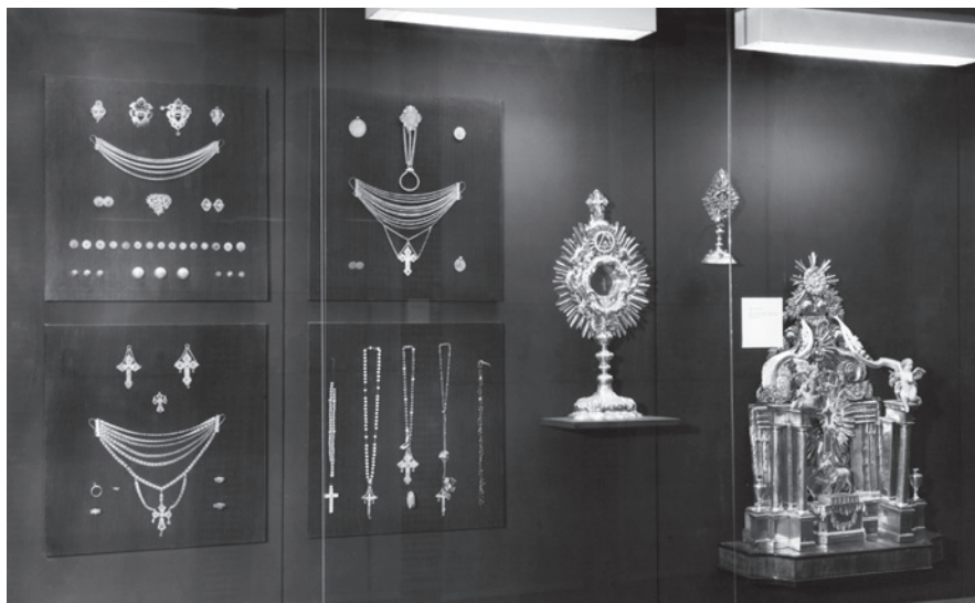
Z expozice muzea, 1965

Již v roce 1998 se ředitelka Slabá pokusila projektem Oděv a jeho doplněk navázat na bývalé mezinárodní výstavy bižuterie. Ambiciózní prezentace se věnovaly současné jablonecké bižuterii ve spojení s módními kreacemi. Konalo se celkem pět ročníků, dva poslední v letech 2008 a 2011 pod názvem Mezinárodní trienále