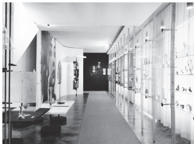
Z expozice muzea, 1964