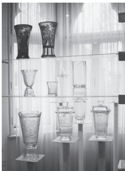
Z expozice muzea, 1995