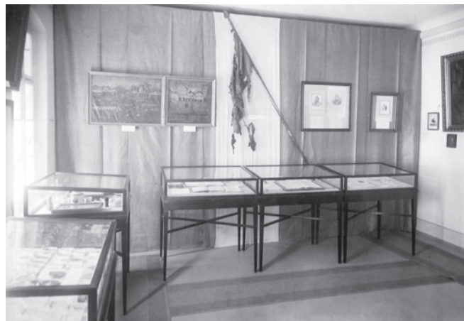
Z výstavy ke 100. výročí porážky Napoleona v bitvě u Lipska, 1913