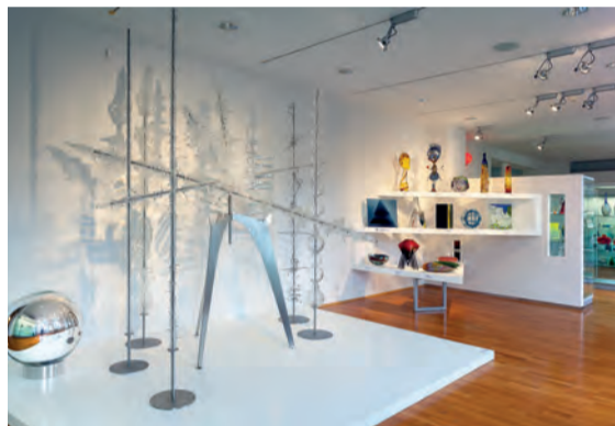
Pohled do expozice ateliérového skla