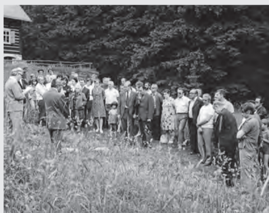
Slavnostní upevnění pamětní desky, 1975