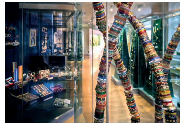
Pohled do expozice bižuterie

užší nominace na cenu Evropské muzeum roku 2024 (rozhodnutí se uskuteční v květnu 2024). Nejvýznamnějším počinem posledních let pak byla úspěšná nominace statku „ruční výroba skla“ na Reprezentativní seznam nehmotného kulturního dědictví lidstva UNESCO, schválená 6. prosince 2023 v Botswaně.