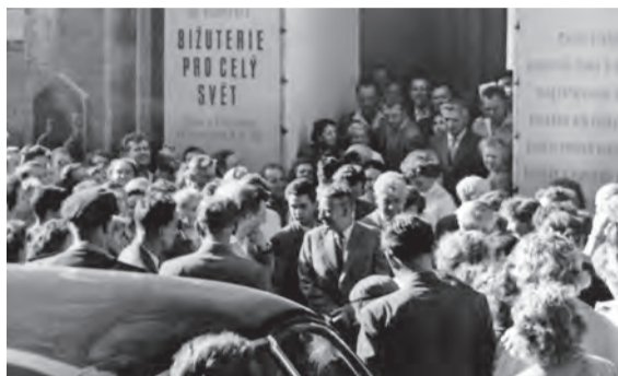
Výstava Bižuterie pro celý svět, 1959