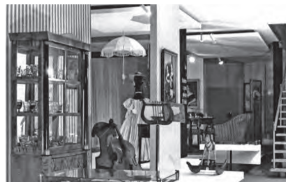
Stálá expozice, 1963