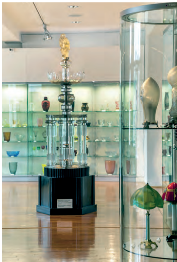
Pohled do expozice skla

V roce 1998 se muzeum pokusilo projektem Oděv a jeho doplněk navázat na bývalé mezinárodní výstavy bižuterie.