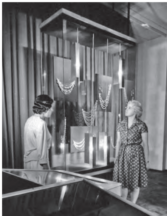
Celostátní bižuterní výstava 1961