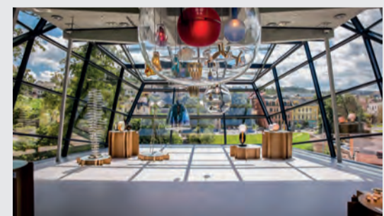
Pohled do výstavní části přístavby

V roce 2024 proběhnou oslavy 120 let od založení muzea. „Připravili jsme řadu novinek a akcí a doufáme, že zapojí co nejširší veřejnost a bude slavit s námi!“, zve k oslavám ředitelka Milada Valečková.