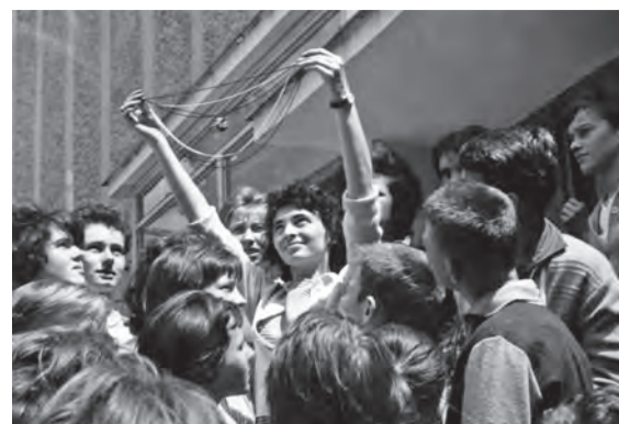
Výstava skla a bižuterie 1963