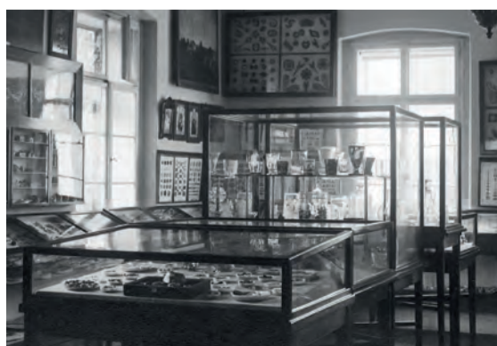
Jedna z prvních expozic v muzeu