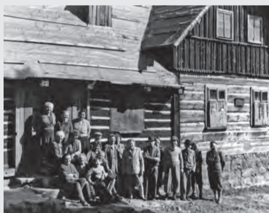
Otevření památníku v roce 1964

V roce 1963 ji získalo naše muzeum a vznikla zde expozice, jedna z nejvýše položených v České republice. Po řadě dřívějších oprav sledujících prostou záchranu objektu se objekt v roce 2016 konečně dočkal celkové rekonstrukce. Objekt je veřejnosti otevřen v letní sezoně a nabízí návštěvníkům stálou expozici (Sklářská osada Kristiánov), dětskou hernu a prodej drobného občerstvení a suvenýrů. Každý rok o první sobotě v měsíci září zde pořádáme oblíbenou Sklářskou slavnost. Charakteristika objektu neumožňuje bezbariérový přístup.