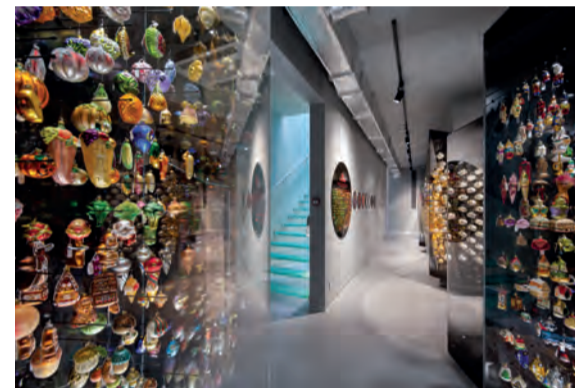
Pohled do expozice vánočních ozdob v přístavbě