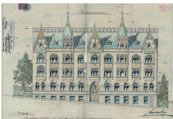
Exportní dům Zimmer & Schmidt (1890–1930)

Na webových stránkách muzea: www.msb-jablonec.cz/120-let